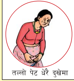
तल्लो पेट धेरै दुखेमा