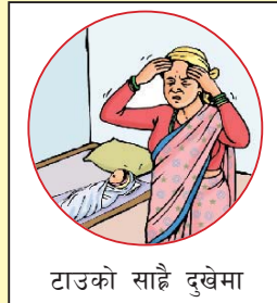
टाउको साह्रै दुखेमा