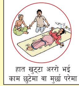
हात खुट्टा अररो भई काम छुटेमा वा मुर्छा परेमा