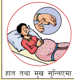
हात तथा मुख सुन्निएमा