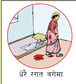
धेरै रगत बगेमा