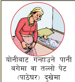
योनीबाट गन्हाउने पानी बगेमा वा तल्लो पेट (पाठेघर) दुखेमा