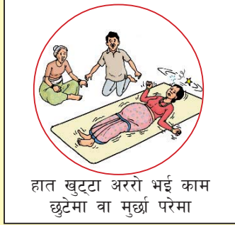
हात खुट्टा अररो भई काम छुटेमा वा मुर्छा परेमा