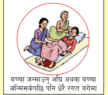
बच्चा जन्माउनु अघि अथवा बच्चा जन्मिसकेपछि पनि धेरै रगत बगेमा