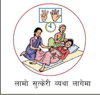
लामो सुत्केरी व्यथा लागेमा