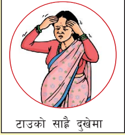
टाउको साह्रै दुखेमा