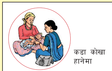
कडा कोखा हानेमा