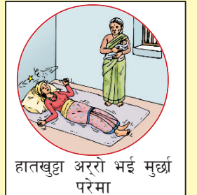
हातखुट्टा अररो भई मुर्छा परेमा