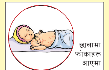
छालामा फोकाहरू आएमा