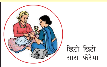
छिटो छिटो सास फेरेमा