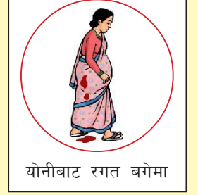
योनीबाट रगत बगेमा