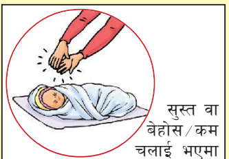
सुस्त वा बेहोस/कम चलाई भएमा