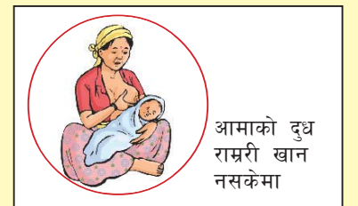
आमाको दुध राम्ररी खान नसकेमा