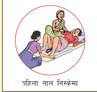
पहिला नाल निस्केमा