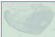
画像をクリックするとパー・チャル・スラ・ボが展開されます。