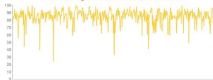
Grafico dati grezzi: da 28-03-2010 a 27-04-2010