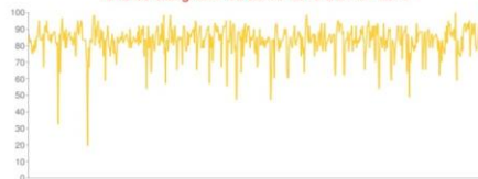
Grafico dati grezzi: da 27-04-2010 a 27-05-2010